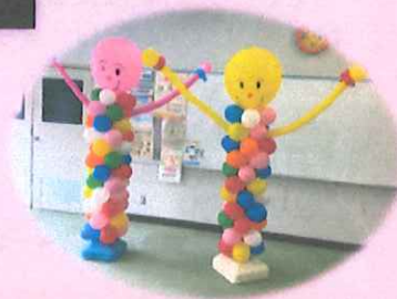
バルーンDEアート作品