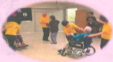
車椅子ダンスの様子