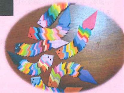
紙ふうせんの作品