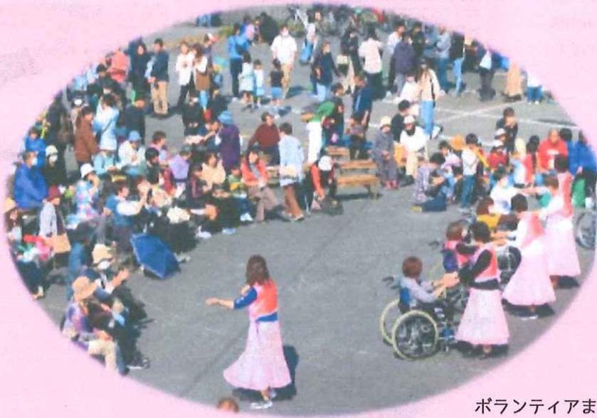
ボランティアまつりの様子