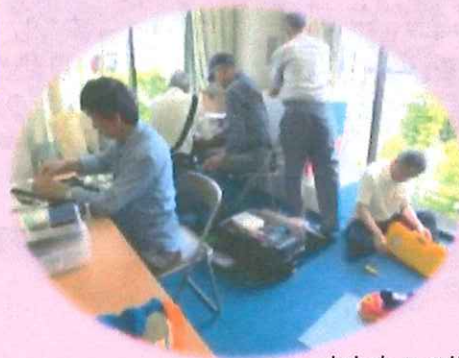
おもちゃの修理の様子