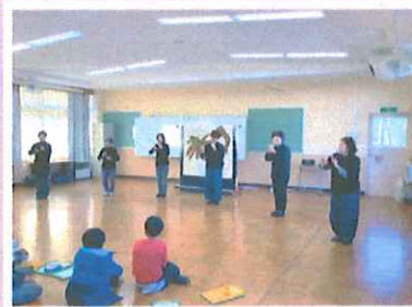
手話の福祉学習授業の様子