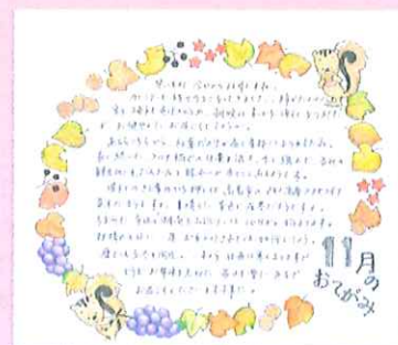
たんぽぽさんの書かれたお手紙