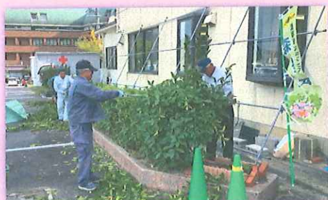
森守会 剪定の様子