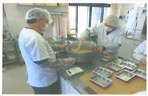
ふれあい給食調理