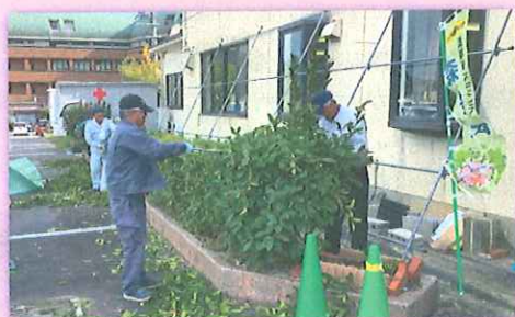
森守会 剪定の様子