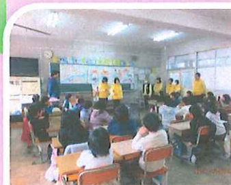
アイマスク体験の福祉学習授業の様子