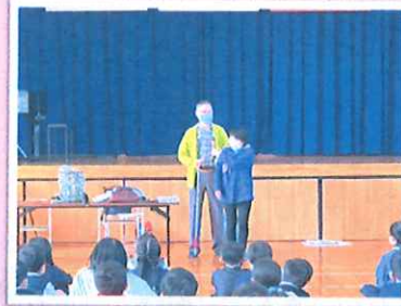
視覚障がい者協会の 福祉学習授業の様子

■甲西院 第1・3水曜日 10:00~12:00 社会福祉センター ■石部院 お人形の病院 第1月曜日 10:00~11:30 石部老人福祉センター ■水戸院 第2土曜日 10:00~12:00 サンヒルズ甲西