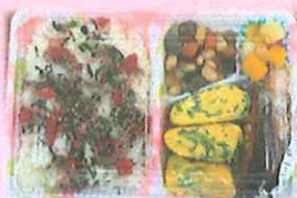
ふれあい給食お弁当の写真