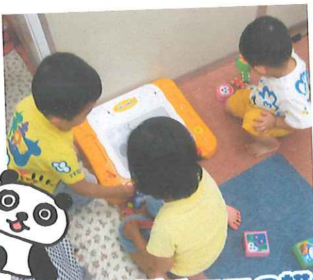
折り紙を折るママの横で 楽しく・元気に遊んでいます