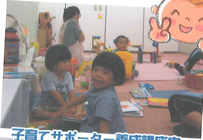
子育てサポーター養成講座中 センター裏にて託児