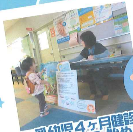
乳幼児4ヶ月健診 ファミサポ出張窓口 始めました