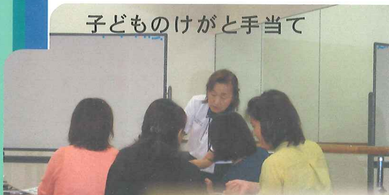
子どものけがと手当て