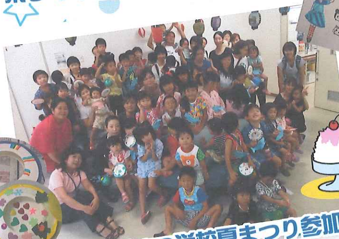
8.27 すずめの学校夏まつり参加 紙皿でフリスビー工作