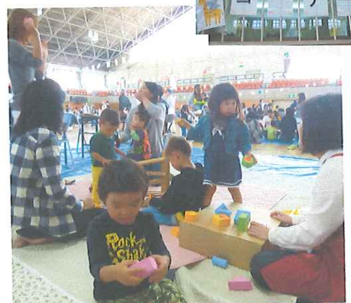
10.24親子ふれあいの集い参加