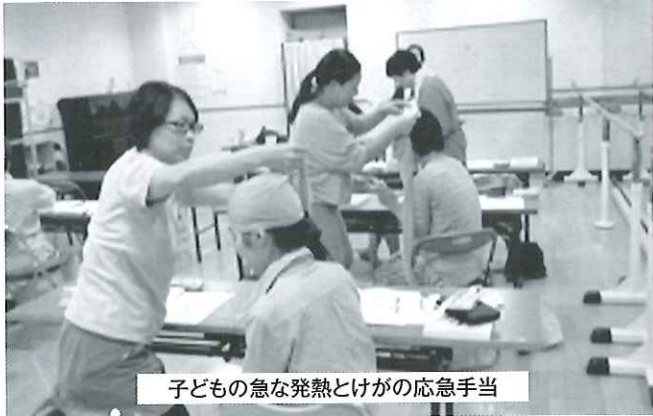
子どもの急な発熱とけがの応急手当