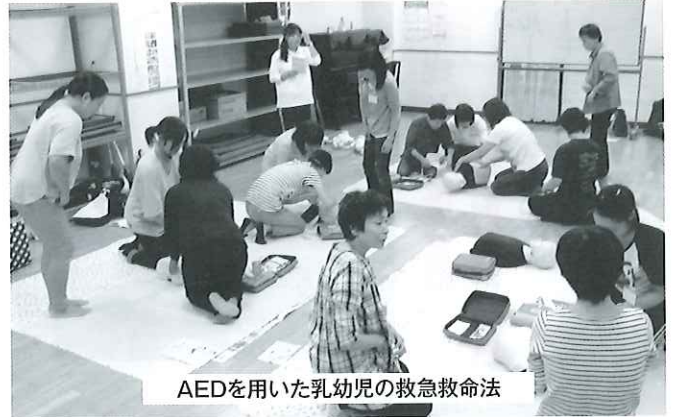
AEDを用いた乳幼児の救急救命法