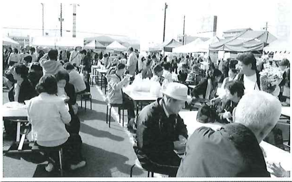
▲模擬店、バザーで大賑わいのテントスペース

湖南市ボランティアの皆さんによる体験、発表、おいしい模擬店、お買い得バザー、子どもの遊び場など。フィナーレはジュニアバンドの演奏！ 小さい子からお年寄りまで楽しめる催しがいっぱい！是非ご家族みなでお出かけください。 《日時》平成26年11月1日（土） 午前10時～午後2時半 バザー、模擬店の売り上げは福祉のために役立たせて頂きます。（昨年は信楽高原鉄道復旧、NPO法人むげ、もみじ・あざみ寮、社協へ寄付しました。）