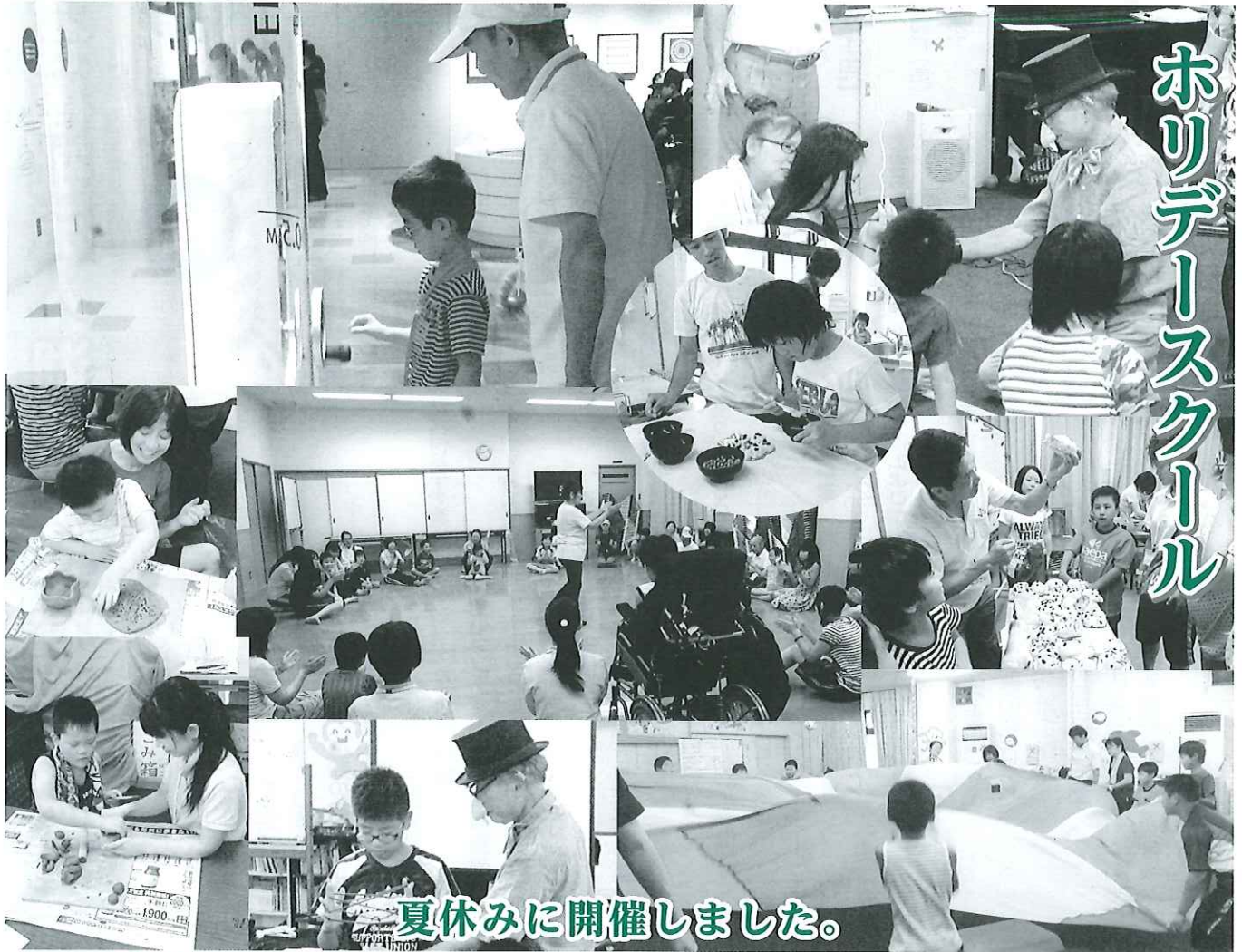
夏休みに開催しました。