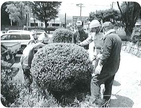
▲森林公園で剪定講座実施指導

「滋賀県レイカティア大学」園芸学科で学び経験してきた「剪定」の知識と技量を、ボランティア精神に基づき「地元」の地域へ還元しよう」と平成23年4月より在校生とOBの22名で活動しています。