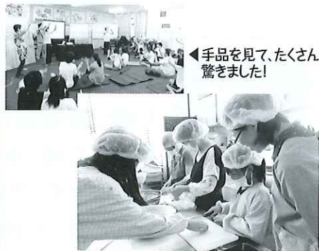
みんなで協力して、おいしいカレーを作りました!▲

延300人近いボランティアさんに支えていただき、今年も子どもたちの笑顔が溢れるホリデースクールになりました。ホリデースクールにご協力していただいたみなさま、本当にありがとうございました。