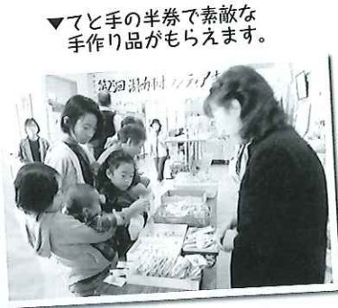
▼7と手の半券で素敵な手作り品がもらえます。