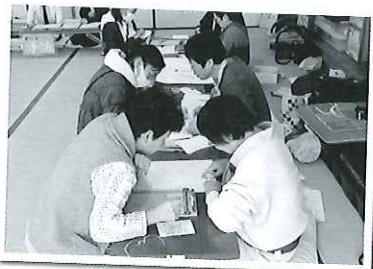
▲2階では点字、手話、折り紙の体験ラリー。景品も！