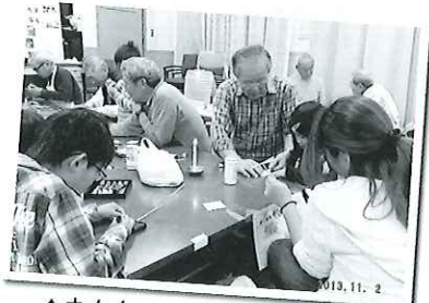
▲おもちゃで遊んだり、作ったり子ども達も一日楽しく。