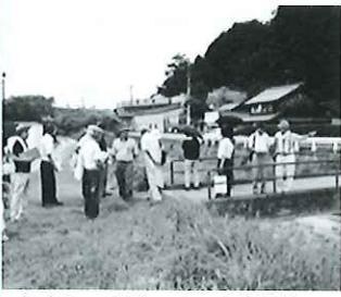
信楽町の被害のあった場所を歩きながら説明を受けました。

その後：受講された方の要望から気軽に集う場「防災さるん」開催することになりました。今後、各地で開催されている防災訓練の様子や防災・減災について考えていきたいと思っています。是非かるって参加ください!