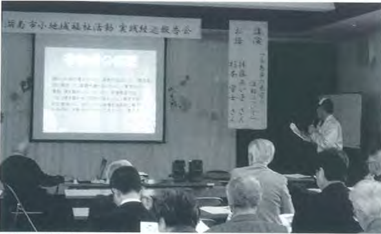
▲実践経過報告会での発表