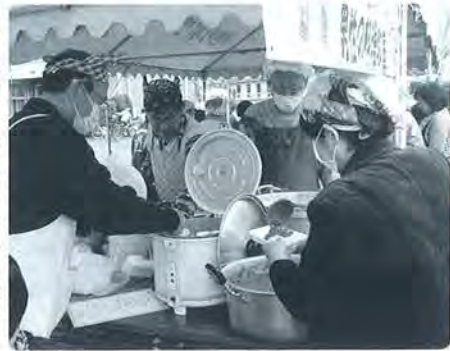
▶初参加 男の料理「石部宿」のカレーライス。大好評