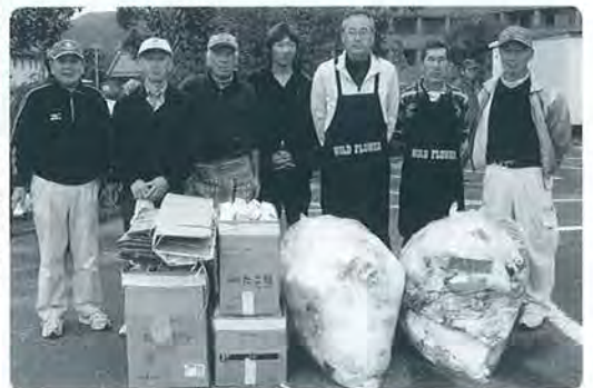
▶ありがとう！特別参加「ワイルド・フラワー」ごみを分別し、こんなにコンパクトに！

私は主婦で、生ごみコンポストに取り組んでおり、また家庭菜園をしていることから特にゴミの問題、土壌、水浄化、食と環境の問題に関連する出展に興味を持ちました。